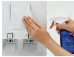
Servis Perawatan Gratis