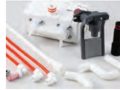
Gratis Instalasi dan Servis Setelah Pembelian

* Remark) For reasons not responsible for the customer during the monthly payment contract, if the product is broken, damaged or lost, we will repair and replace parts free of charge. But if your monthly payment is overdue or unpaid, your service may be stopped.