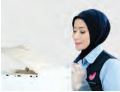
Servis Regular 2 Bulan

Semua produk water purifier Coway telah disertifikasi Water Quality Association (WQA). Beli dengan Package 72 , dan nikmati Coway HEART SERVICE™ kami selama 72 bulan.