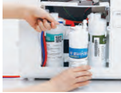
Filter Gratis dan Servis Reparasi